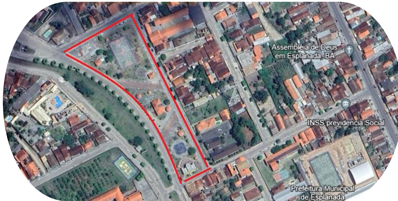
Imagem: Google Terra. Vista área da Praça Nossa Senhora da Pompéia (2022), Esplanada-Ba. Disponível em: https://maps.app.goo.gl/zvezjKL7gJjj6DQf8 . Acesso em 26 mai. 2024