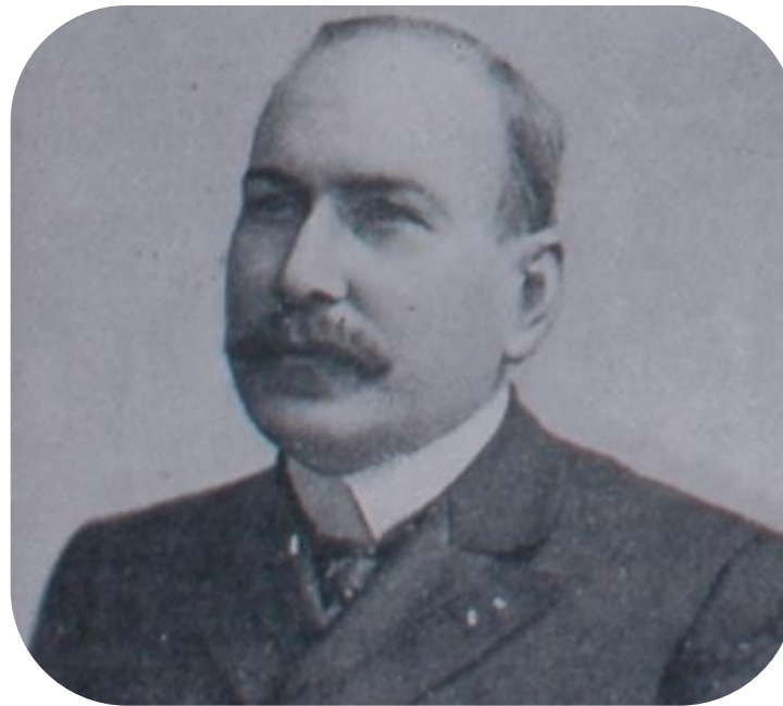
José Joaquim Seabra

Veraneio, na Vila, do governador da Bahia, José Joaquim Seabra - JJ Seabra.