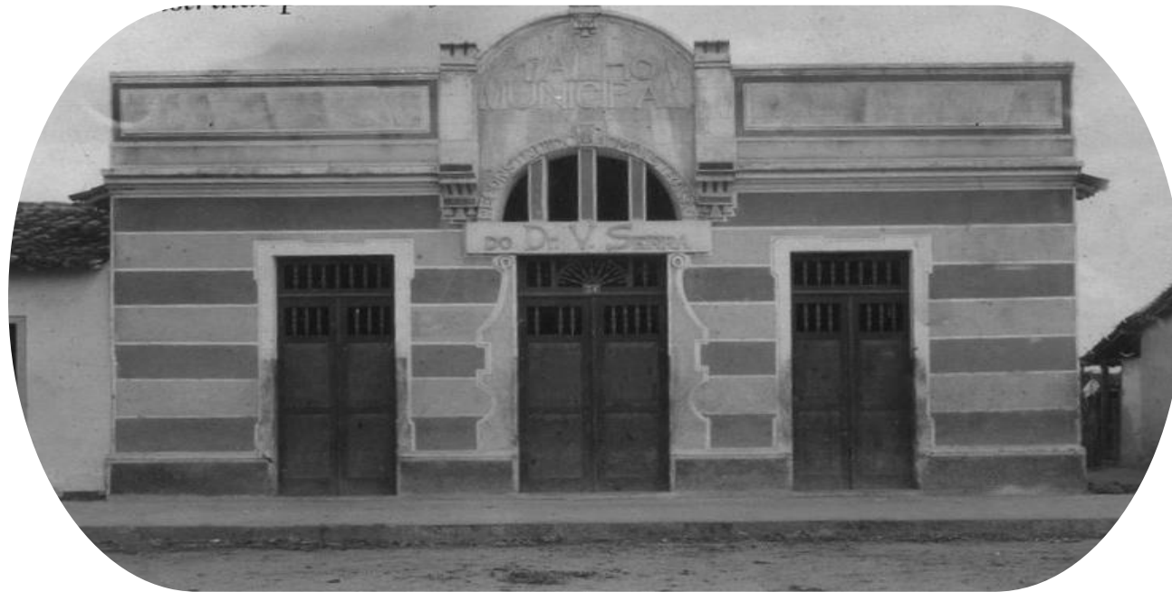
Imagem: Fotógrafo desconhecido. 1º mercado de carnes de Esplanada-Ba. Disponível em: https://historiadeesplanada.blogspot.com/ . Acesso em: 25 mai. 2024