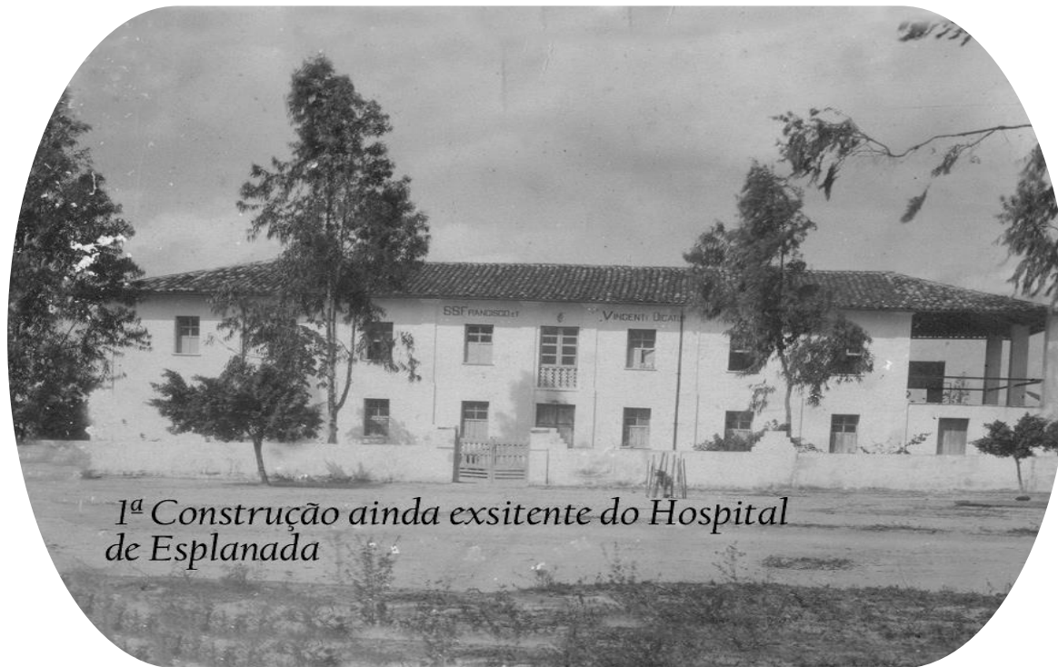
1ª Construção ainda existente do Hospital de Esplanada