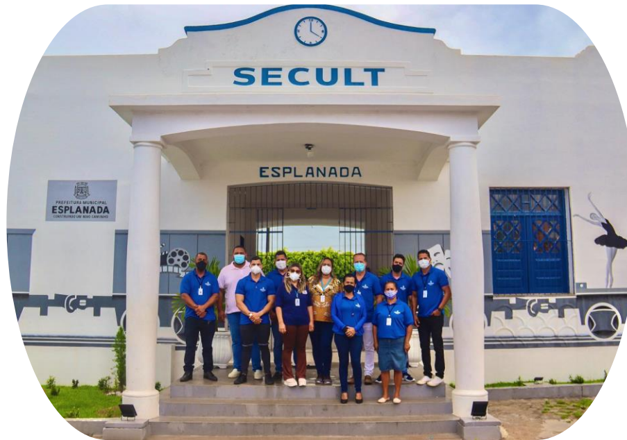
Sede da da Secretária de Cultura e Turismo de Esplanada, Ba. 2021. Disponível em: https://www.facebook.com/secult.esplanada.ba/photos/pb.100064428114170.-2207520000/129351865826958/?type=3. Acesso em: 06 jun. 2024.

Instalação da Secretaria de Cultura do Município no edifício da antiga Estação Ferroviária de Esplanada.