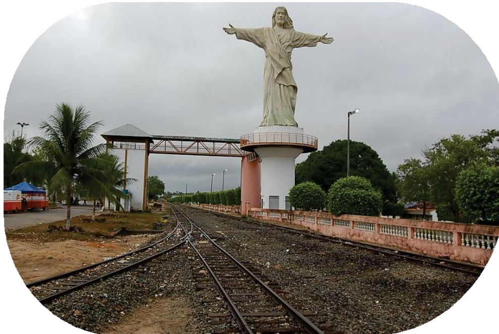
Cristo Redentor de Esplanada-Ba, 2020. Disponível https://www.flickr.com/photos/149239290@N05/49888636861. Acesso em 25 mai. 2024.