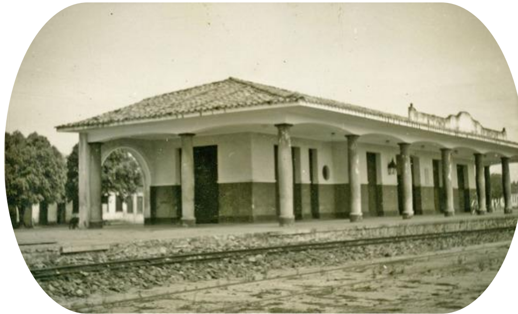
Imagem: Fotografia desconhecido. Gare da V.F.F Leste Brasileiro. Esplanada, Ba, 1957. Disponível em: https://cidades.ibge.gov.br/brasil/ba/esplanada/historico . Acesso em 04 jun. 2024.

Inauguração da GARE (estação férrea) de Esplanada do Timbó, então distrito do Conde-Ba. Atualmente (2024), a estação sedia a secretaria de cultura do município de Esplanada.