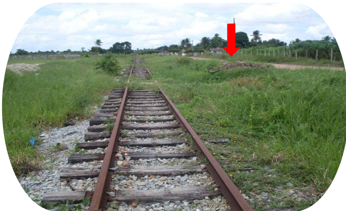
Imagem: Sydney Corrêa. Trilhos da estação ferroviária do Timbó, Esplanada-Ba, 2010. Disponível em: http://www.estacoesferroviarias.com.br/ba_propria/timbo.htm . Acesso em: 29 mai. 2024.