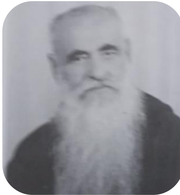
Frei Gregório di San Marino