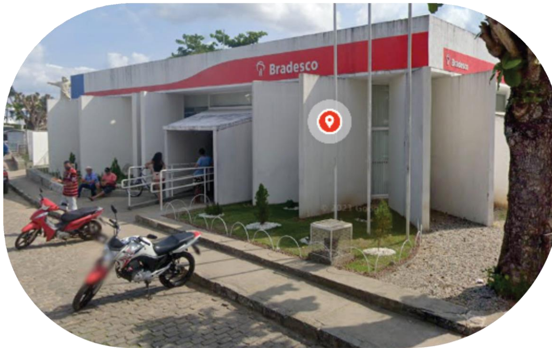
Agência do Bradesco, Esplanada - Ba, 2021.

Inauguração da sede da Agência do BANEBA (atual agência do Bradesco)