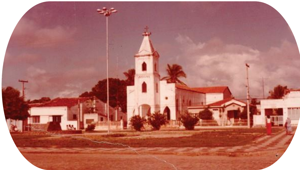
Imagem: Fotografia desconhecida. Igreja de Nossa Senhora da Piedade, 1983. https://cidades.ibge.gov.br/brasil/ba/esplanada/historico . Acesso em: 12 abr. 2024