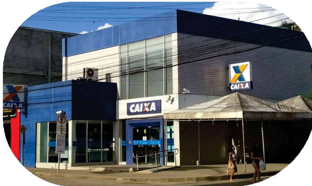
Imagem: Fotografia desconhecida. Agência da CEF de Esplanada, Bahia, 2021. Disponível em: https://www.memoriasdeestancia.com.br/memoriasdeestancia . Acesso em 05 jun. 2024.