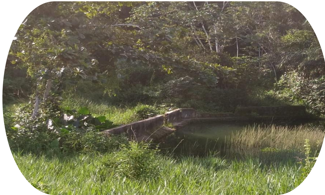
Aspecto atual da antiga Fonte da Bica. Esplanada, maio de 2024.