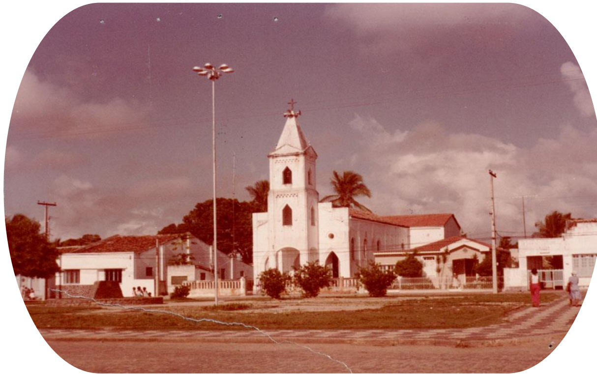
Imagem: Fotógrafo desconhecido. Igreja de N. S. Da Piedade, Esplanada-Ba, 1983. Disponível em: https://cidades.ibge.gov.br/brasil/ba/esplanada/historico . Acesso em: 28 mai. 2024.