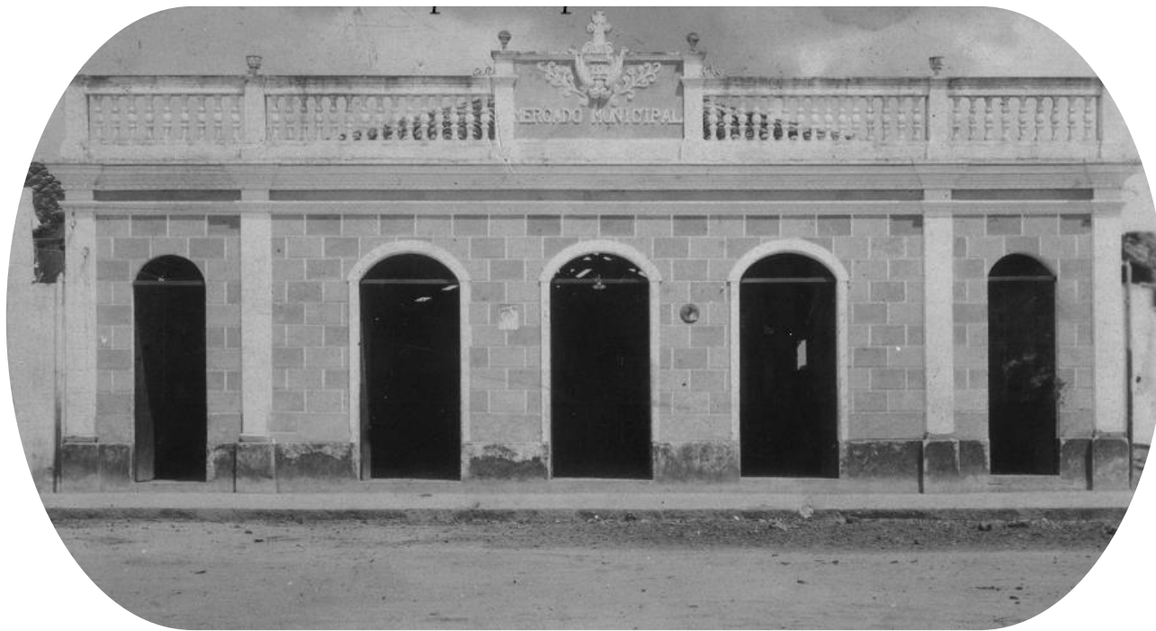
1º Mercado de Municipal de Esplanada.