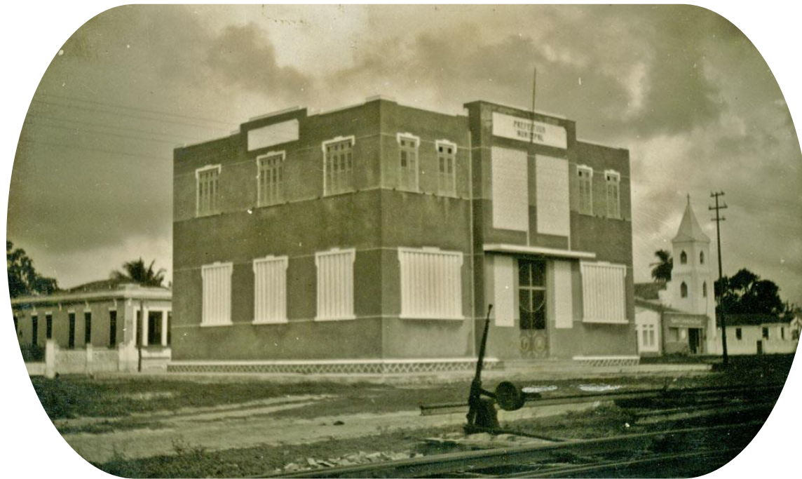
Imagem: Fotógrafo desconhecido. Prefeitura Municipal – Esplanada, Ba, 1957. Disponível em: https://cidades.ibge.gov.br/brasil/ba/esplanada/historico . Acesso em 25 mai. 2024