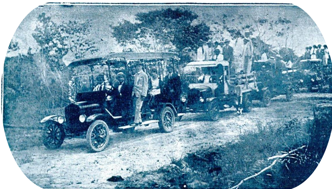
Imagem e informações: Fotografia desconhecida. [Comitiva de Esplanada partindo para a inauguração da rodovia Esplanada/Conde, 7 de dezembro de 1926]. Em: Renascença . Ano 11, n. 145, Bahia, dezembro de 1926, p. 33.